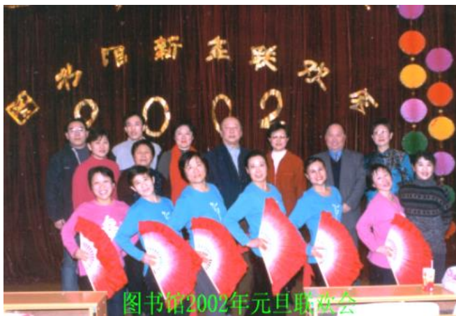
图书馆2002年元旦联欢会

在新年来临之际，为表达我馆对离退休同志们敬意和关心，12月21日我馆请老同志们欢聚在友谊餐厅，我馆党、政、工领导到现场祝老同志们健康长寿，老同志们也祝愿图书馆事业兴旺发达。